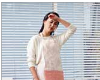
Los que estan preocupados por los gases dañinos de la cocina