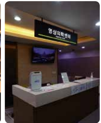
En la sala de Espera