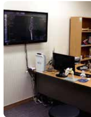
En la Oficina del Doctor