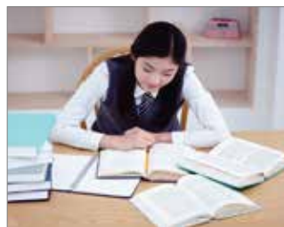
Para estudiantes que necesitan de cuidados especiales de salud