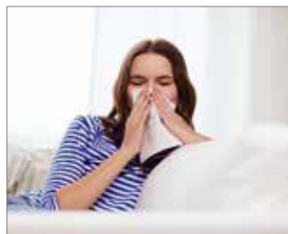
Aquellos que sufren de dermatitis atópica, asma o todo tipo de alergias