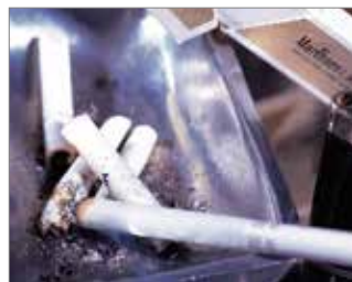
Aquellos que sufren con los malos olores de tabaco y comida