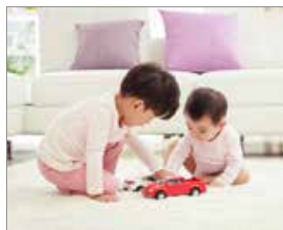
Bebés y mayores con sistemas autoinmunes débiles