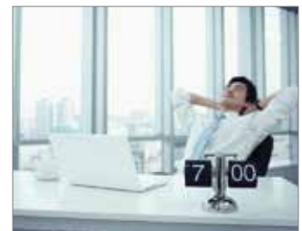
Para aquellos que pasan muchas horas de exposición en hospitales y escuelas