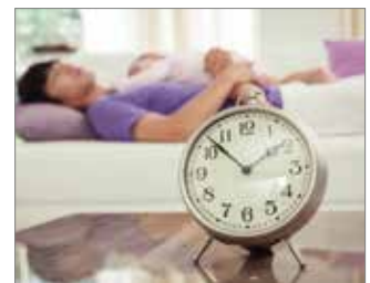
Aquellos que desean disponer de un aire purificado 24/7 sin preocuparse de riesgos