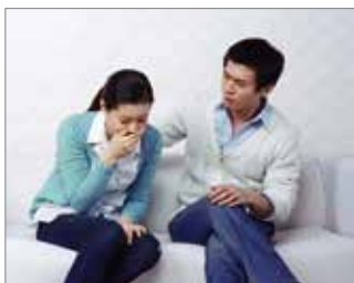
Para los que están preocupados por la pandemia del Coronavirus, entre sus familiares, empleados y/o clientes.